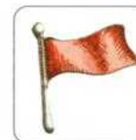
potrzeba wody i żywności