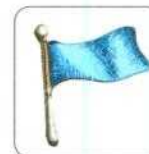
potrzeba pomocy medycznej